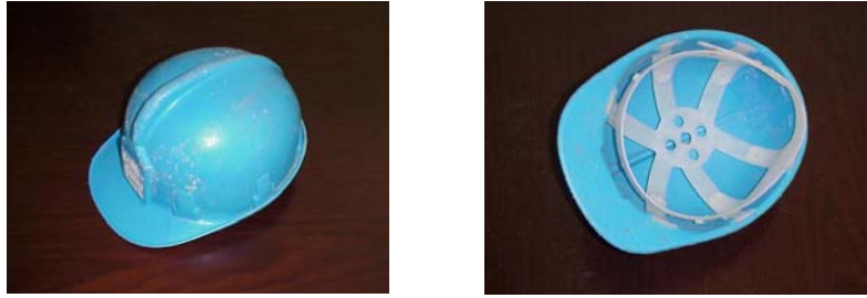
Figs. 1 y 2

Estos cascos pueden ser adquiridos, por debajo de su coste real, en rastros, mercadillos de segunda mano, desguaces, etc.