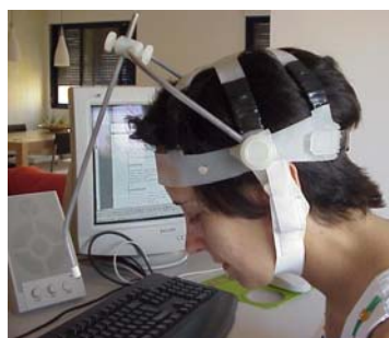
Figs. 6 y 7