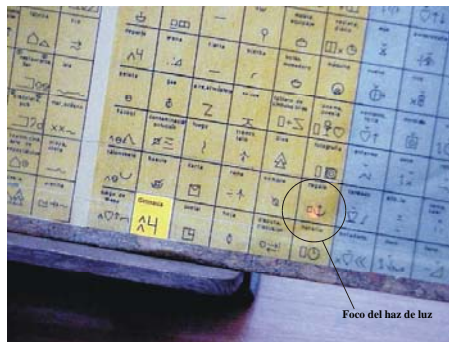
Figs. 10 y 11